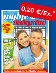
my life - Lieblingrätzel