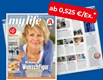
my life + TV-Teil