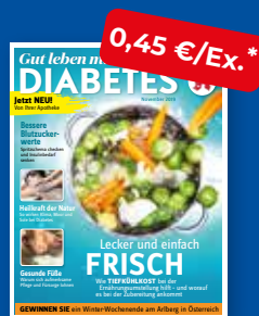
Gut leben mit DIABETES

* Alle Preise gelten zzgl. MwSt.; darüber hinaus gelten die allgemeinen Vertrags- und Geschäftsbedingungen des Zukunftspakts Apotheke. Für Kunden, die zu Werkzeiten nicht regelmäßig von teilnehmenden Großhändlern beliefert werden, fallen zusätzlich Verpackungs- und Versandkosten von 16,80 € monatlich für das Basispaket (my life ohne TV-Teil) an. Für Zusatzbuchungen über das Basispaket hinaus (TV-Teil, weitere Hefte der my life-Magazinfamilie) werden Verpackungs- und Versandkosten auf die tatsächlich bestellte Menge erhoben. Dafür werden die Bestellmengen und Ausstattung (mit/ohne TV) in Verpackungseinheiten umgerechnet. Jedes Paket kostet 8,40 €. Das Team Zukunftspakt Apotheke berechnet auf Anfrage gerne die Versandkosten für Zusatzbuchungen.