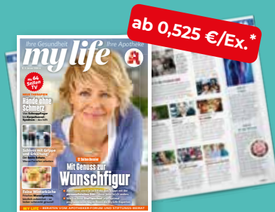
my life + TV-Teil