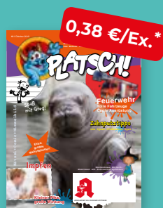
„PLATSCH!“ Das Kindermagazin

* Alle Preise gelten zzgl. MwSt.; darüber hinaus gelten die allgemeinen Vertrags- und Geschäftsbedingungen des Zukunftspakts Apotheke. Für Kunden, die zu Werkzeu- nicht regelmäßig von teilnehmenden Großhändlern beliefert werden, fallen zusätzlich Verpackungs- und Versandkosten von 16,80 € monatlich für das Basispaket (my life ohne TV-Teil) an. Für Zusatzbuchungen über das Basispaket hinaus (TV-Teil, weitere Hefte der my life-Magazinfamilie) werden Verpackungs- und Versandkosten auf die tatsächlich bestellte Menge erhoben. Dafür werden die Bestellmengen und Ausstattung (mit/ohne TV) in Verpackungseinheiten umgerechnet. Jedes Paket kostet 8,40 €. Das Team Zukunftspakt Apotheke berechnet auf Anfrage gerne die Versandkosten für Zusatzbuchungen.