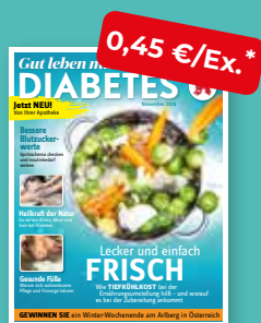
Gut leben mit DIABETES