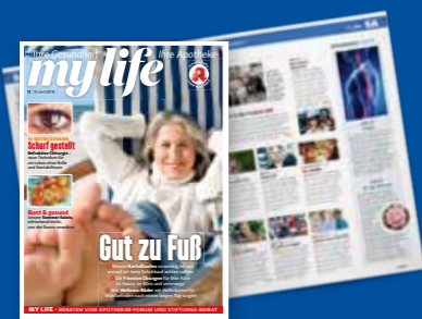
my life + TV-Teil