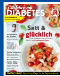
Gut leben mit DIABETES