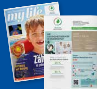
my life Individualisierung