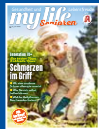
my life Senioren