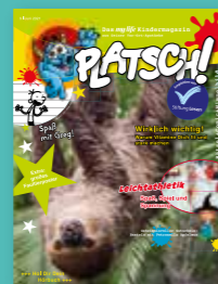
„PLATSCH!“ Das Kindermagazin