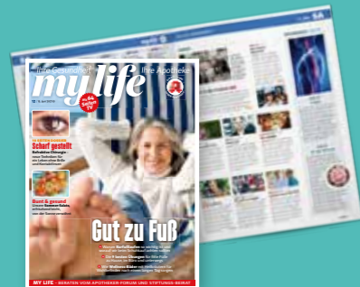
my life + TV-Teil