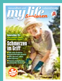
my life Senioren