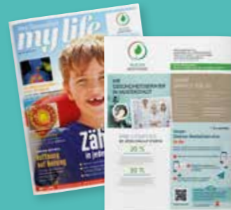
my life Individualisierung